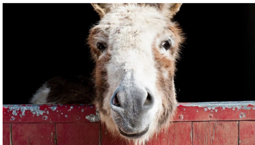
Do Donkeys Act?

Bild hinten: On The Beach At Night Alone , eine Illustration von Miro Denck Instagram: @miroschnee Website: miredenck.com