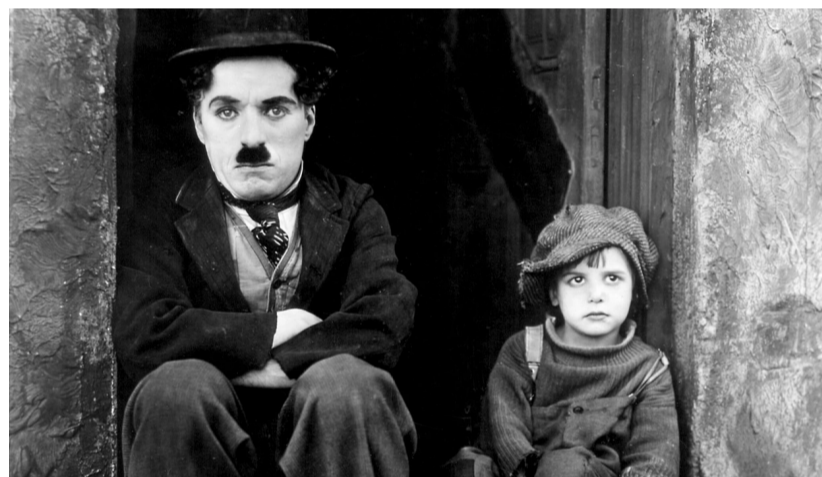
Der Vagabund und das Kind von Charlie Chaplin

Der Vagabund Charlie findet ein Neugeborenes direkt neben ein paar Mülltonnen. Zunächst versucht er das Baby wieder loszuwerden, doch dann fasst er sich ein Herz und kümmert sich liebevoll um das Kleine. Er gibt dem Jungen den Namen John und zieht ihn groß. Gemeinsam werden sie ein unschlagbares Team. In seinem ersten abendfüllenden Spielfilm erinnert sich Charlie Chaplin an seine eigene Kindheit in den Armenhäusern Londons. Ein Filmvergnügen für Groß und Klein: Anmutig und einnehmend verbindet Chaplin Tragik und Sozialkritik mit großen Emotionen und Poesie.