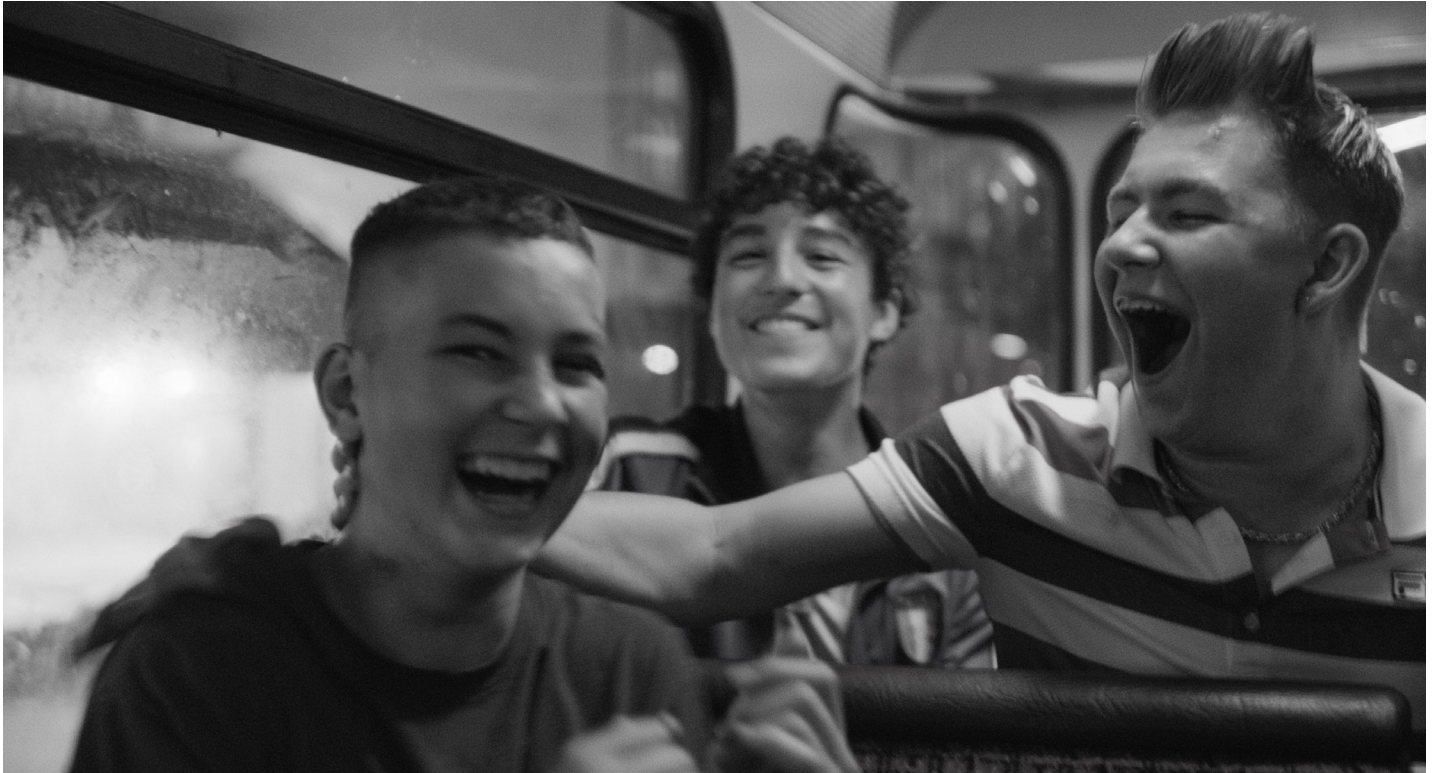
Sonne und Beton von David Wnendt