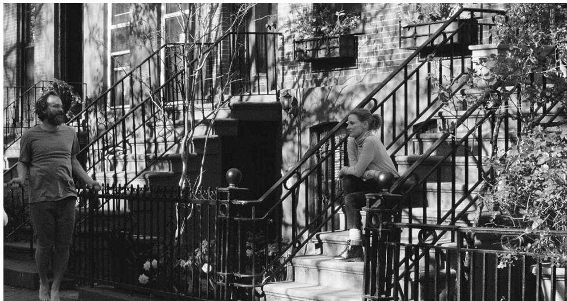
MEMORY von Michel Franco