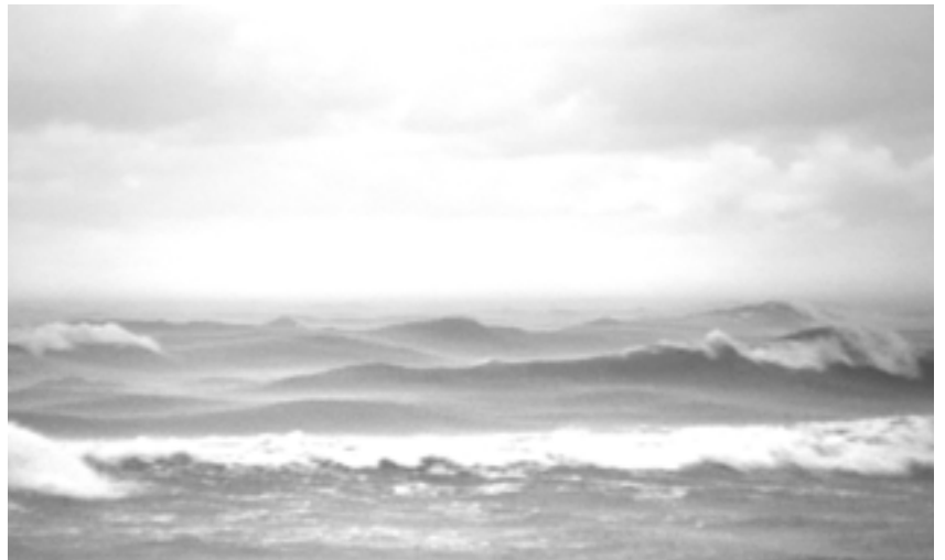
SEESTÜCK von Volker Koepp

Die Ostsee in ihren jahreszeitlichen Stimmungen, das helle Licht und die Luftspiegelungen, die Wolken am hohen Himmel, die Vögel im Sturm über den Wellen. Vor der magischen Naturkulisse begegnen wir Menschen, die an den Rändern der Ostseeländer leben: auf der Insel Usedom und an den polnischen Stränden, an den baltischen Küsten und den nördlichen Schären in Schweden. Fischer und Wissenschaftler, Seeleute und junge Menschen erzählen von ih-