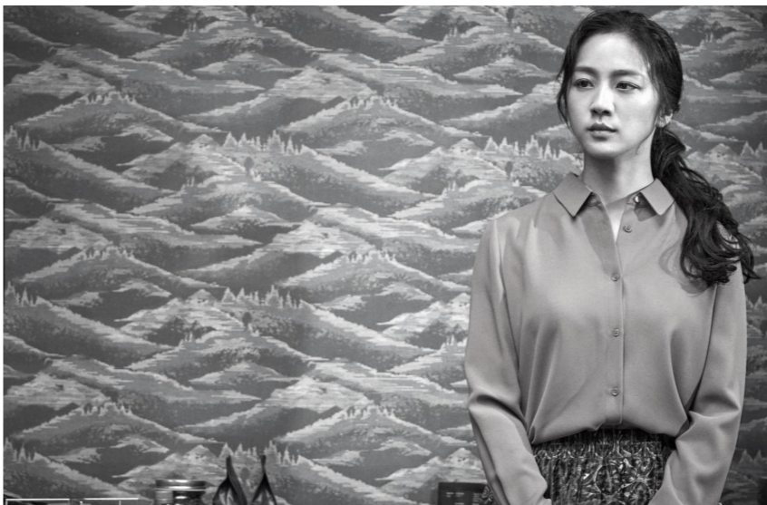
Die Frau im Nebel (Desicion to Leave) von Park Chan Wok

Wir freuen uns, Mark Cousins am Samstag, den 14. Februar im Anschluss an die Vorführung um 18.30 Uhr zu einem Gespräch zu begrüßen!