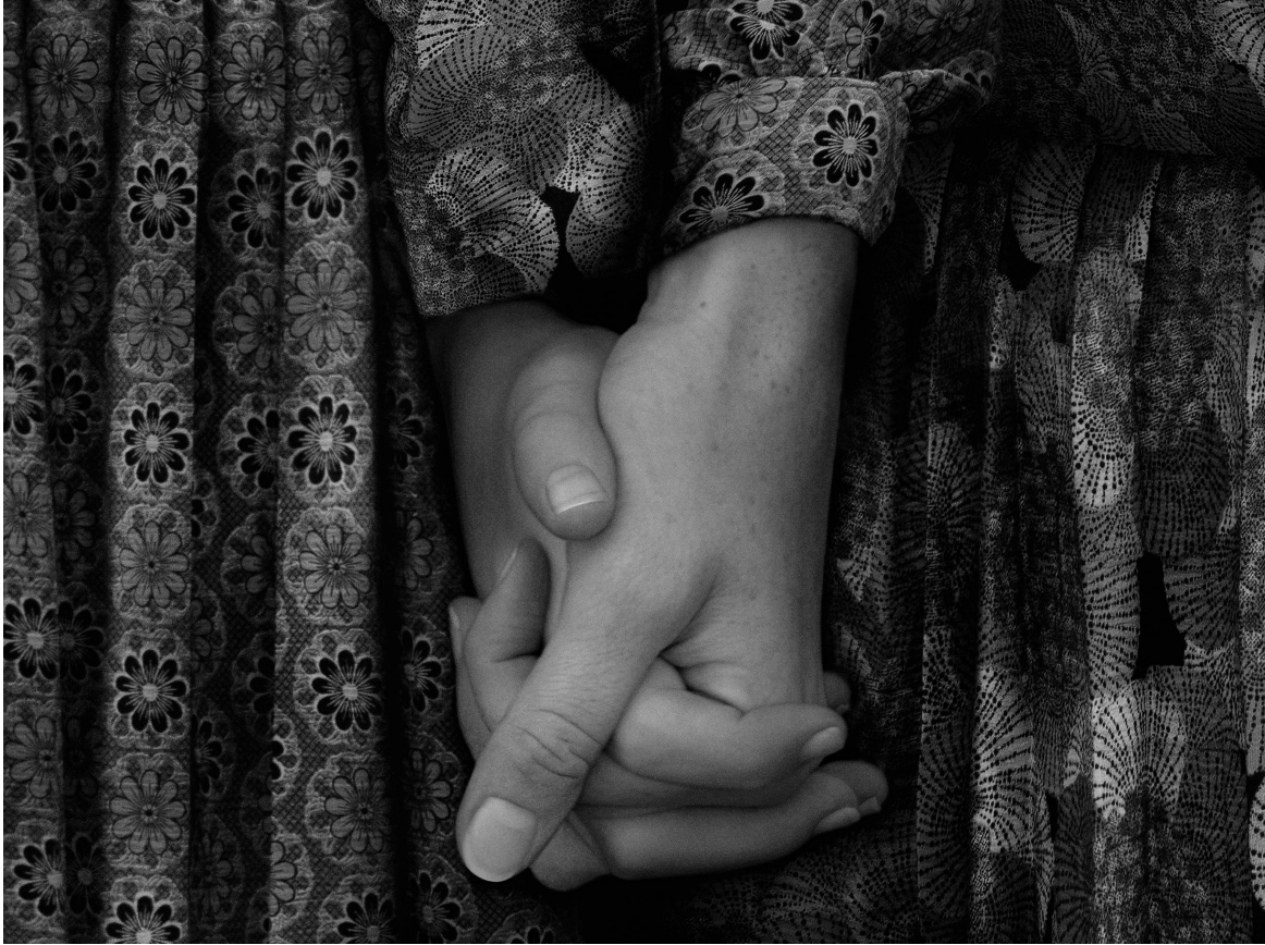
Die Aussprache (Women Talking) von Sarah Polley